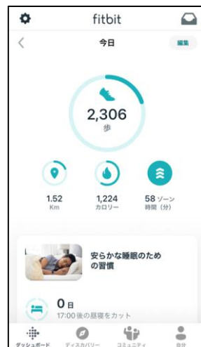
Fitbit本体→アプリへ取込